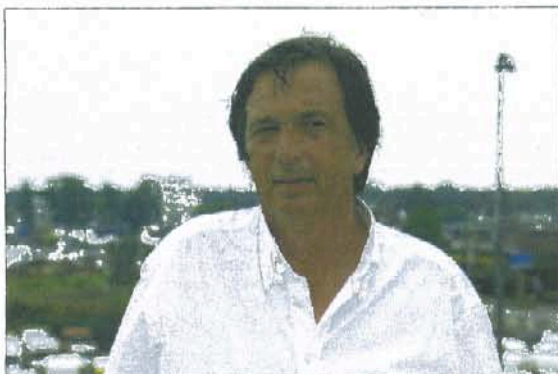
„Ik werd steeds enthousiaster over Barneveld.”

‘Het leuke van ons vak is dat het zo gevarieerd is’