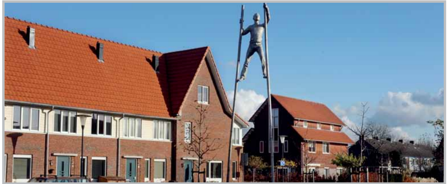
In de Boomgaard zie je inmiddels heel goed de intentie van het plan.

Nieuw Oosteinde zoals dat er nu staat, is ooit ontstaan op de tekentafel van SVP Architectuur en Stedenbouw in Amersfoort. Een Aalsmeers dorp, waarin bestaande en nieuwe buurten op een dorpse wijze