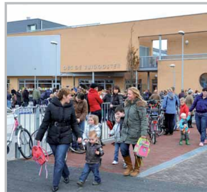
De brede school is volop in gebruik.

terug aan het overleg met bewoners gedurende alle jaren van ontwikkeling. "Zij hebben een belangrijke rol gespeeld. Voor de bewoners van Aalsmeer Oost is er veel veranderd en dat was soms echt slikken. Toch is er een groep mensen die actief heeft meegewerkt. Bijvoorbeeld bij het nadenken over voorzieningen, het