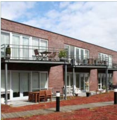
Houten Leebrug duurzame grasdaken maken wonen op school aantrekkelijk