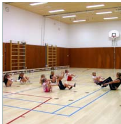
Amersfoort De Brink Brede School sfeervolle gymzaal ook geschikt voor festiviteiten