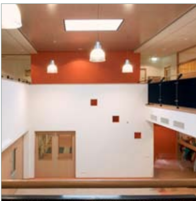
Amersfoort ABC School vide over twee verdiepingen als centraal hart voor allerlei activiteiten