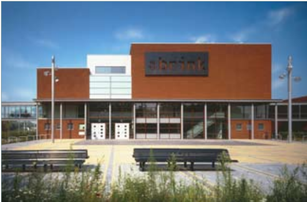
Amersfoort De Brink Brede School herkenbaar schoolgebouw als ontmoetingsplek voor de wijk