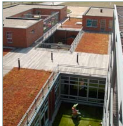
Almere Slimme School wonen op school als in een 21 e eeuwse hofje