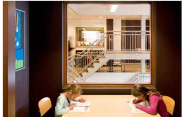
Wormer School en woningen verborgen plek met doorkijkje om rustig te kunnen werken